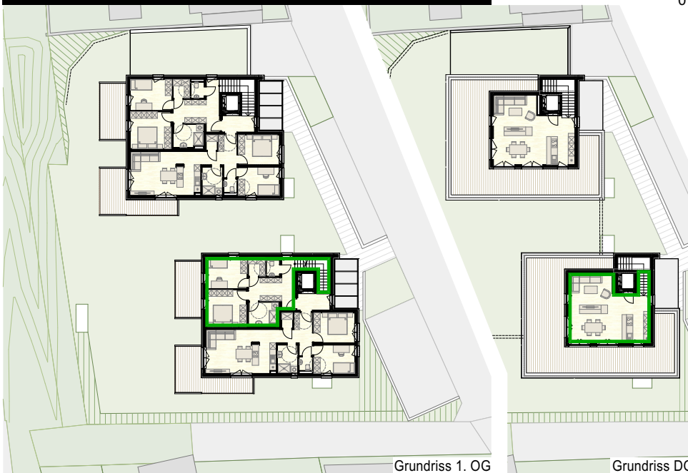
Grundriss 1. OG